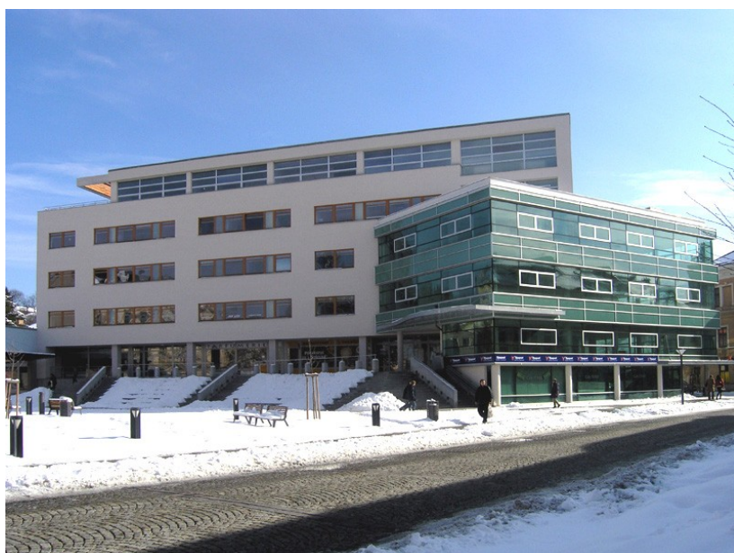
Masarykova veřejná knihovna Vsetín

Komise doporučuje Městské knihovně Veselí nad Moravou nominaci do soutěže MK ČR Knihovna roku, kategorie Informační počin za mimořádně zdařilou rekonstrukci knihovny ve spolupráci s městským architektem a nadstandardní interiéry zařízené pro uživatele a návštěvníky všech generací.