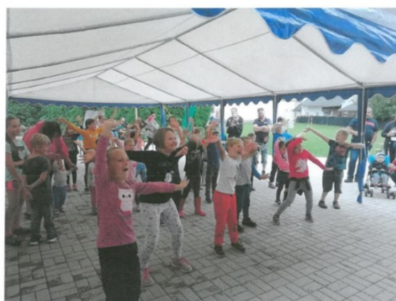
Z akce Místní knihovny Znětínek

Místní knihovna Znětínek připravila projekt Rozloučení s prázdninami. Akce se konala koncem prázdnin a toto setkání má svoji letitou tradici, kdy se setkávají děti i dospělí. V rámci této akce se vždy koná pasování prvňáčků. S podporou SKIP Velká Morava bylo možné pozvat Divadlo Kejkle z Brna, součástí společenského odpoledne, které pokračovalo do večerních hodin, byly různé soutěže pro všechny účastníky. Celkem bylo na akci 84 účastníků, z toho 39 dětí.