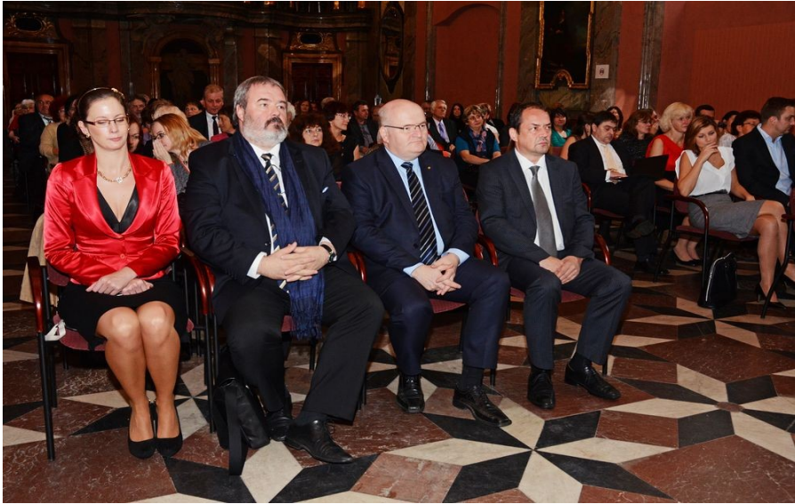
Cenu Knihovna roku 2014 předal ministr kultury Mgr. Daniel Herman