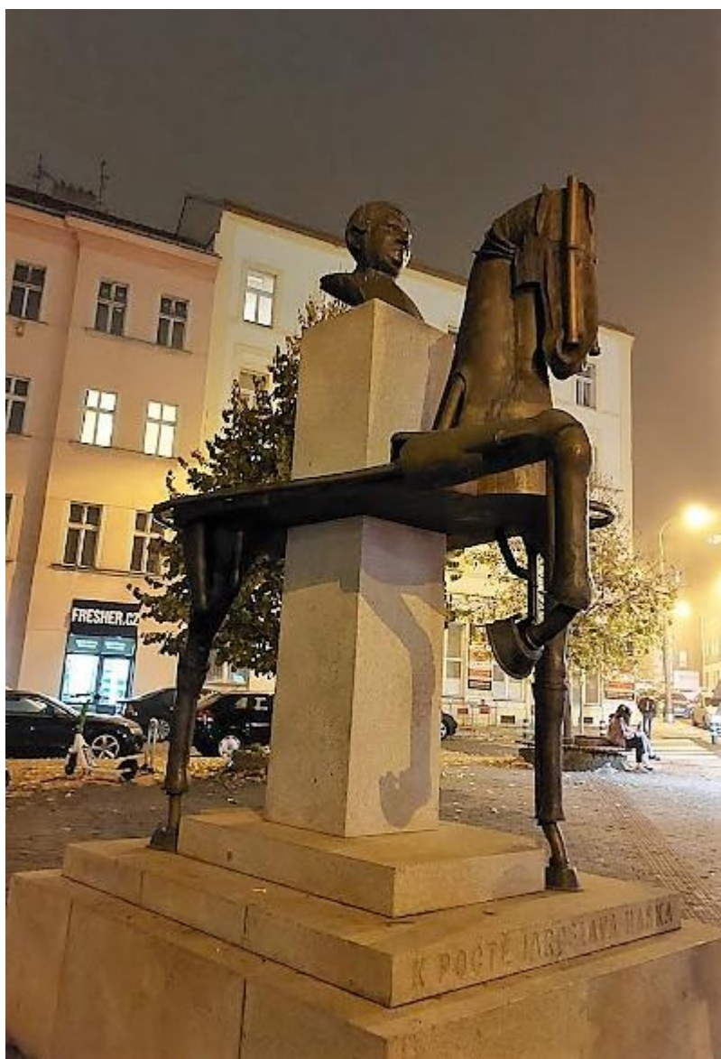
Žižkovský recesistický jezdecký pomník Jaroslava Haška od Karla Nepraše