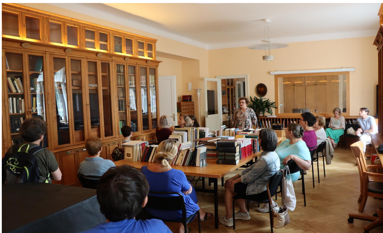
V Muzikologické knihovně Ústavu dějin umění AV ČR, v. v. i.