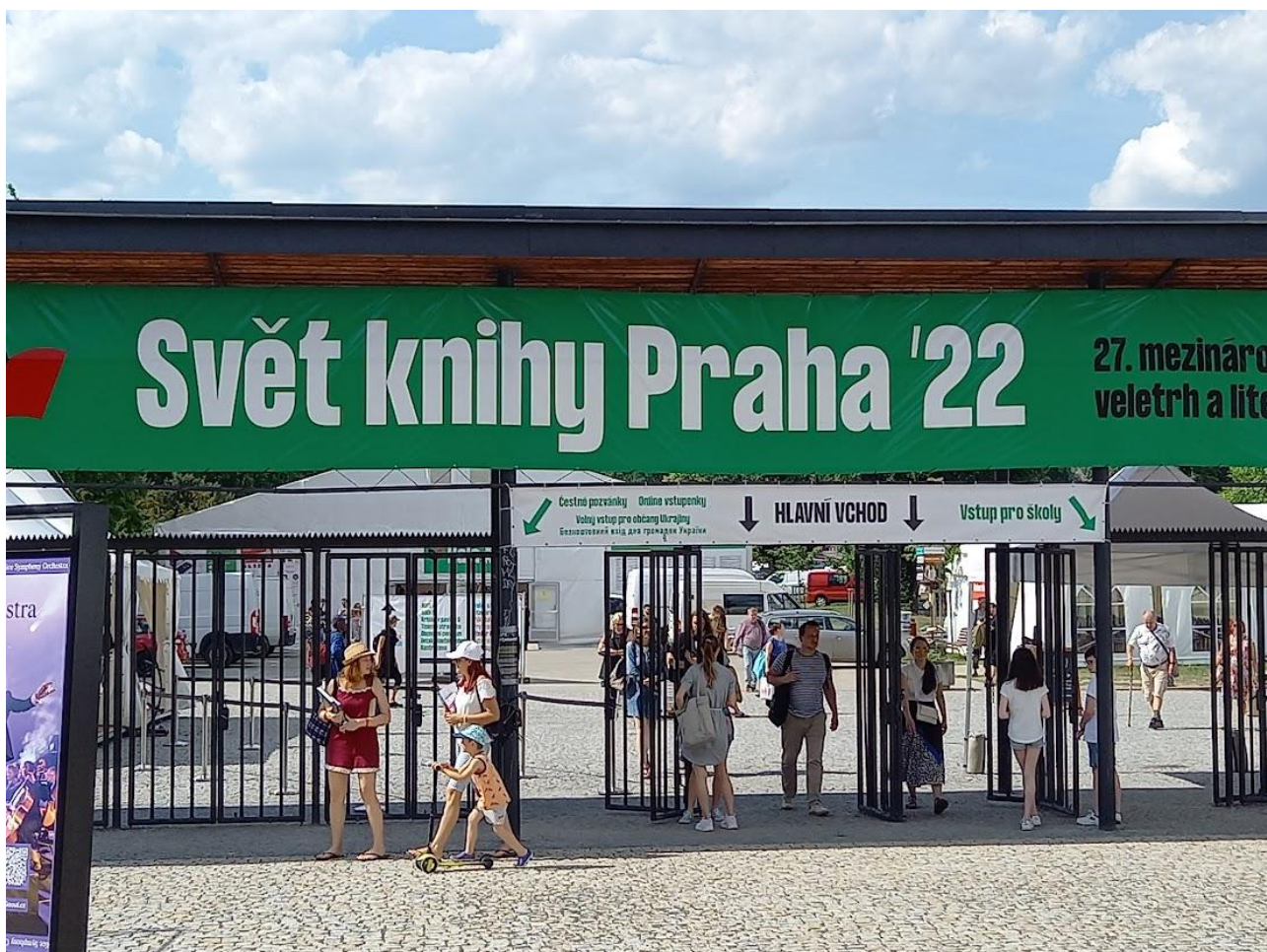
Svět knihy 2022