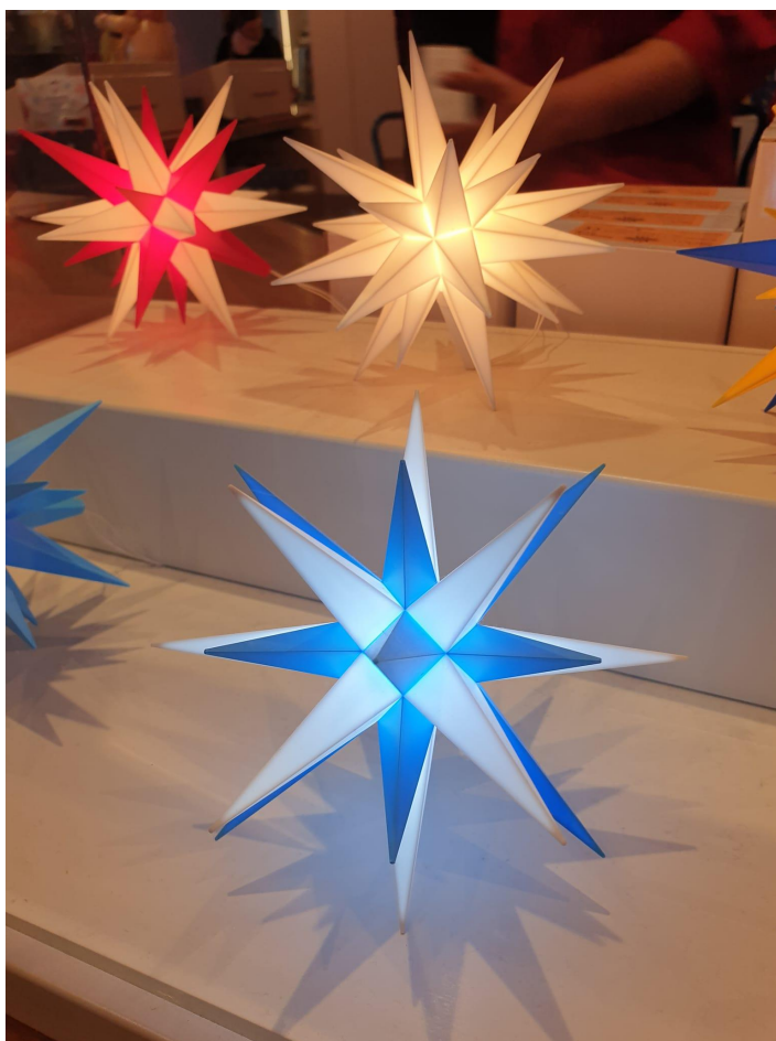
Z adventního Ochranova

Dne 3. 12. se uskutečnil tradiční adventní zájezd , tentokrát do Zhořelce/Görlitz, Ochranova/Herrnhutu a Žitavy/Zittau . Také v sousední Lužici drží původní vánoční obyčeje, které splývají s moderní oslavou narození Ježíška. Hned za naší hranicí zaplnili mnohá náměstí trhovci se svými vánočními výrobky a lákali k návštěvě i české občany. Nezbytná pyramida, vánoční strom a písně, živá vystoupení souborů byli charakteristickými znaky adventu. Na starobylém náměstí historického města Zhořelce se konal vánoční trh v duchu středověku. Vánoční kultura v Lužici má i ryze český produkt. Emigranti, kteří sem přišli, založili městečko Ochranov. V roce 1821 začali vyrábět vánoční hvězdy jako symbol betlémského světla a dnes jsou hvězdy známé po celém světě. Od roku 1880 se ochranovská hvězda začala v Herrnhutu vyrábět komerčně – a vyrábí se tu dodnes v okázalé manufaktuře. Před ní se konávají adventní a vánoční trhy, které jsme navštívili a které bezpochyby patří k těm nejkrásnějším v Německu. Do historického centra jsme přijeli na svažené víno nebo klasickou německou klobásu, bratwurst.