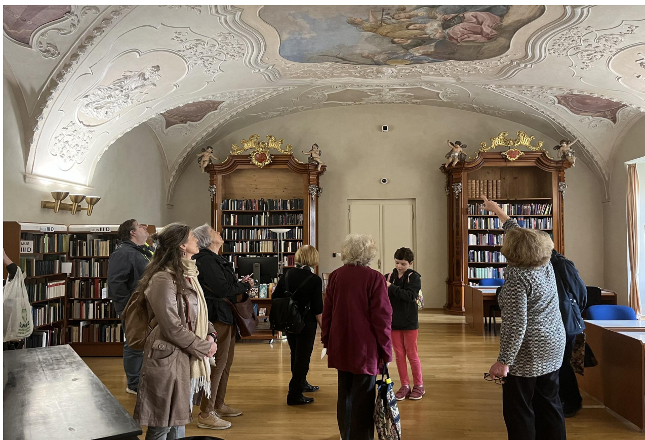
V Hudebním oddělení Národní knihovny ČR