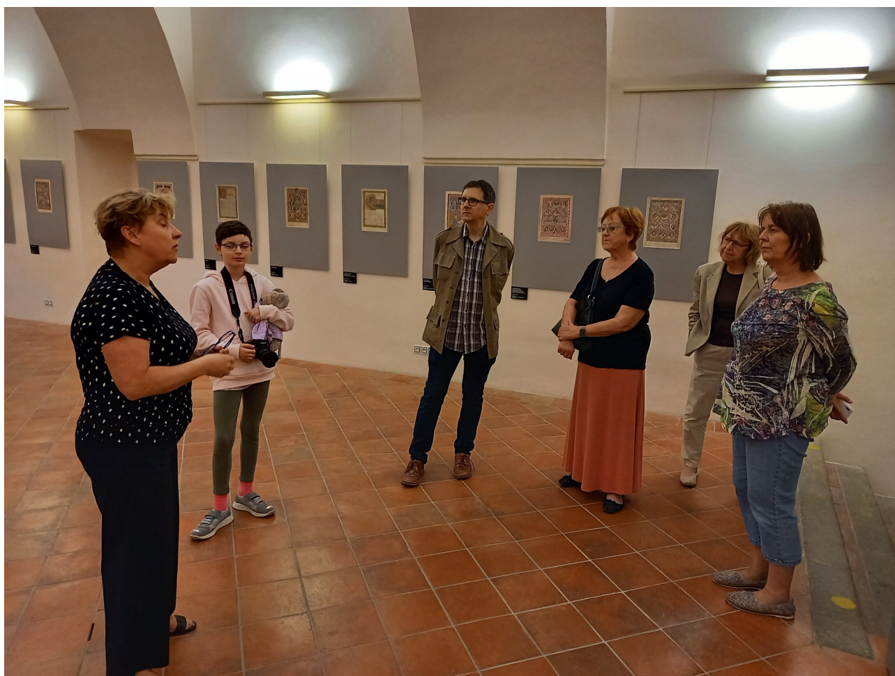
Komentovaná prohlídka výstavy v Galerii Klementinum