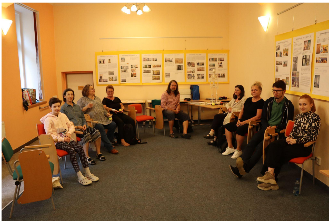
Účastníci Dílničky pro oči a péči o zrak