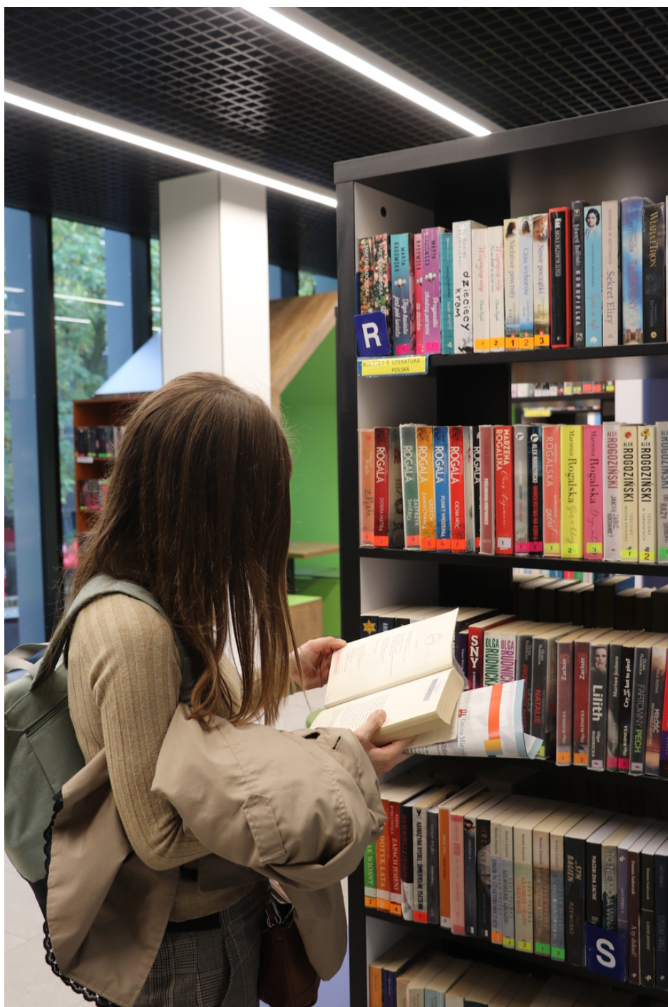
Někteří využili příležitost a navštívili i boleslavskou knihovnu

Dne 8. 10. proběhl zájezd do Boleslavce , polského města keramiky. Navštívili jsme muzeum keramiky a z památek a jiných historických artefaktů jsme viděli historické centrum města, farní kostel Nanebevzetí Panny Marie a sv. Mikuláše nebo třeba klášterní dům Alžbětinek z roku 1907. Polské město Boleslawiec, které by se dalo přeložit i jako Boleslav, je proslulé výrobou řemeslné keramiky. V tomto dolnoslezském městě se keramika vyrábí od 19. století a do dnešní doby neztratila svůj tradiční půvab. Historie výroby keramiky sahá až do středověku. Ve městě působí dodnes několik tradičních manufaktur zabývajících se výrobou keramiky. V obchodě přímo v manufaktuře jsme zakoupili spoustu krásné keramiky. Program byl obohacen o návštěvu krásného města Zhořelec, resp. Görlitz.