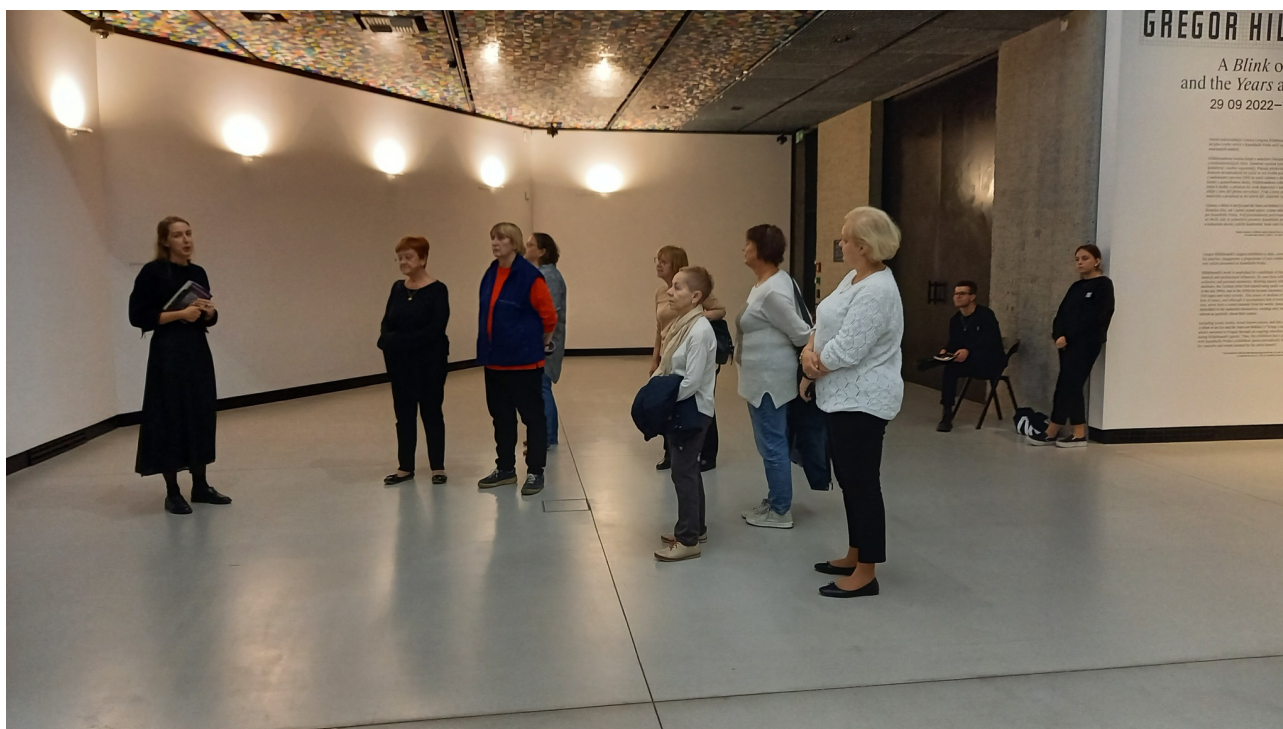
Komentovaná prohlídka výstavy v Kunsthalle Praha