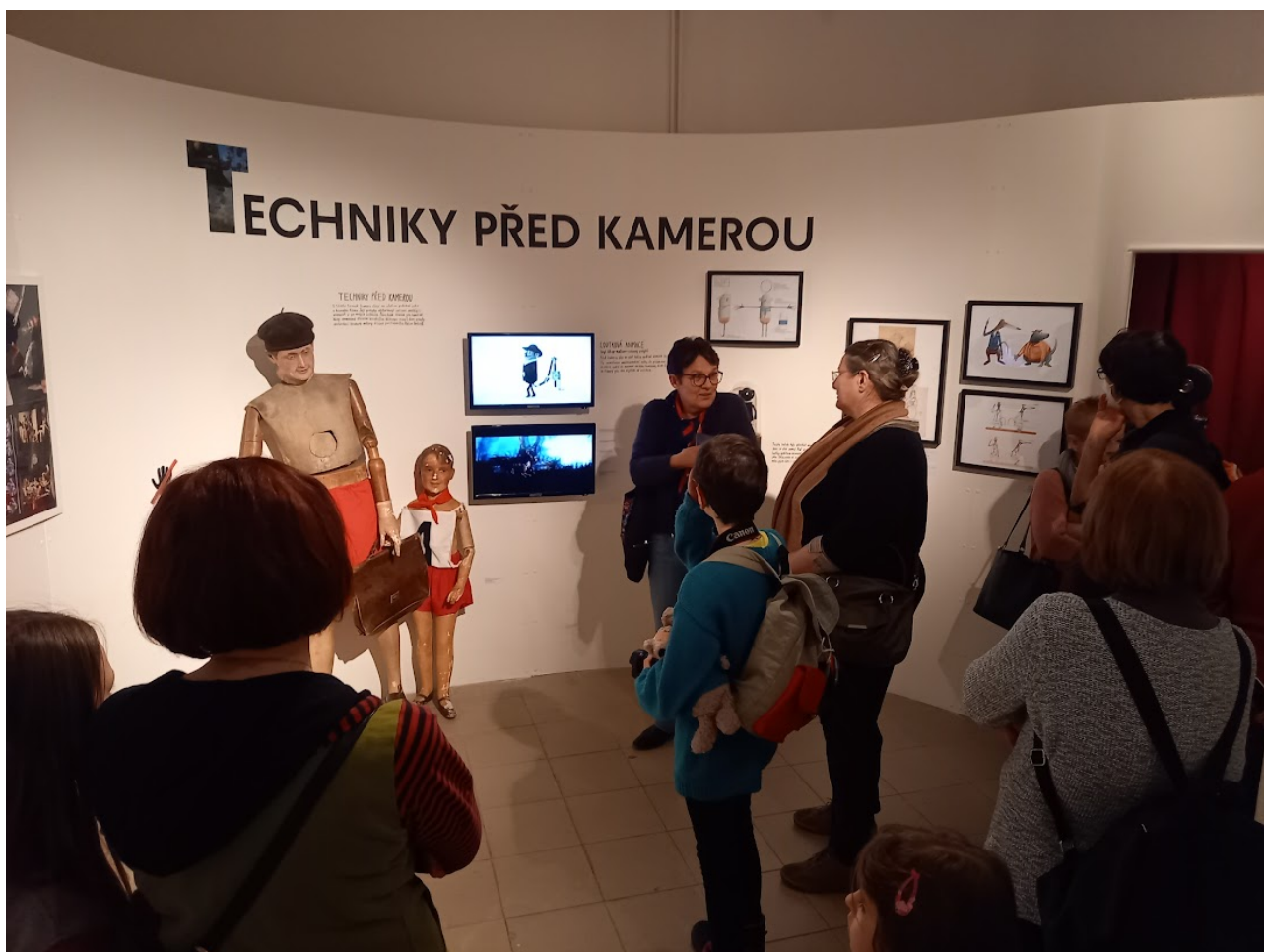
Komentovaná prohlídka výstavy Světy české animace