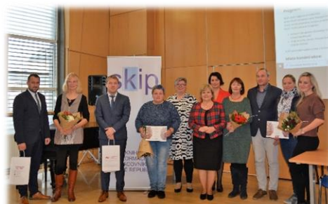
Nejlepší knihovny Libereckého kraje

Liberecký kraj ve spolupráci s KVK Liberec a SKIP pořádal soutěž již popáté. Každá z oceněných knihoven získala finanční dar ve výši 10.000 Kč. Za okres Česká Lípa zvítězila Obecní lidová knihovna v Okrouhlé, za Jablonec nad Nisou Místní knihovna Jílové u Držkova, za okres Liberec Místní knihovna ve Višňové a za ten semilský pak Obecní knihovna Studenec.