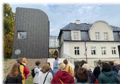
Knihovna ve Vratislavicích