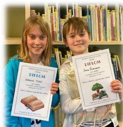
Čteme všichni, vypráví jen někdo