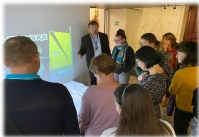
Severočeské muzeum v Liberci