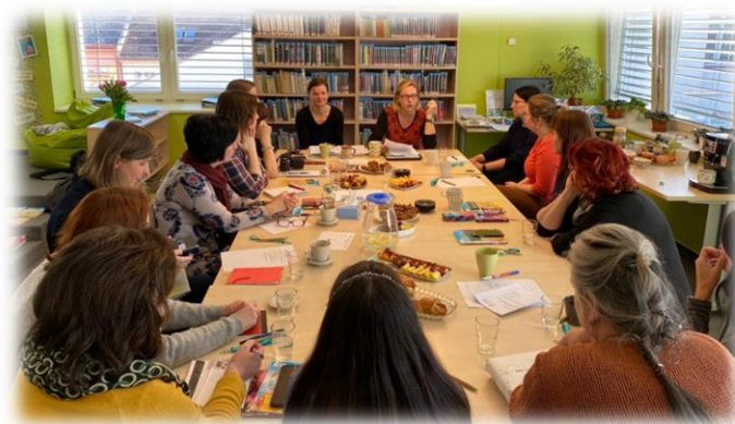
Setkání KDK v Semilech 8. 3. 2022