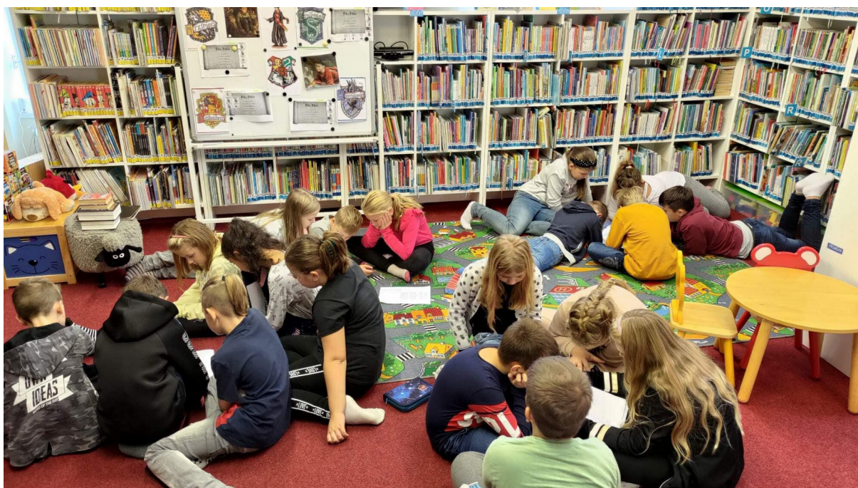
Městská knihovna Břeclav – pobočka Poštorná, projekt Harry Potter

Celoroční projekt pro 4. třídy: Harry Potter - sbírání ingrediencí do lektvarů - soutěží mezi sebou jednotlivé koleje. Bojovky, hledačky, stezky: Čarodějnická, Čertí, Strašidelná, Vánoční a Pohádková, Ptačí (přezimující ptáci).