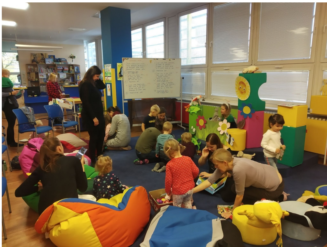
MěK Hodonín, Škvrňata a batolata do knihovny natotata, 25.10.2022, v rámci projektu

MěK Hodonín, oddělení pro děti + pobočka Brandlova pořádají dopolední programy pro děti do 4 let s doprovodem (4x ročně) Škvrňata a batolata do knihovny natotata. Vede je ve spolupráci s knihovnicí místní ochotnická herečka, která si připravuje autorská divadélka se čtením, povídáním, zpíváním, muzicírováním, poučením. Připravený program nebo prvky z něj, se svolením lektorky, používá knihovnice v programech pro MŠ. Program navštěvují většinou maminky s dětmi ve věku 1-2 roky a miniškolka při místním Centru pro rodinu.