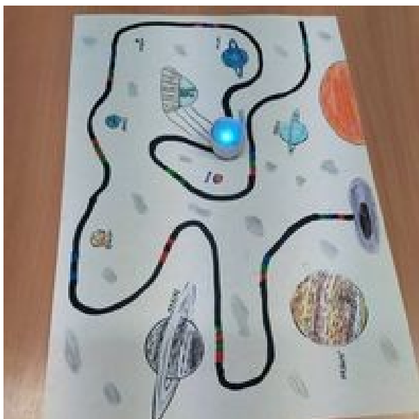
Městská knihovna Břeclav – pobočka Poštorná, Výprava na měsíc

Ve spolupráci se Skandinávským domem v Praze realizovali programy o Mumíncích pro ZŠ i veřejnost = literárně kulinářské zážitky s brusinkovým čajem a sušenkami.