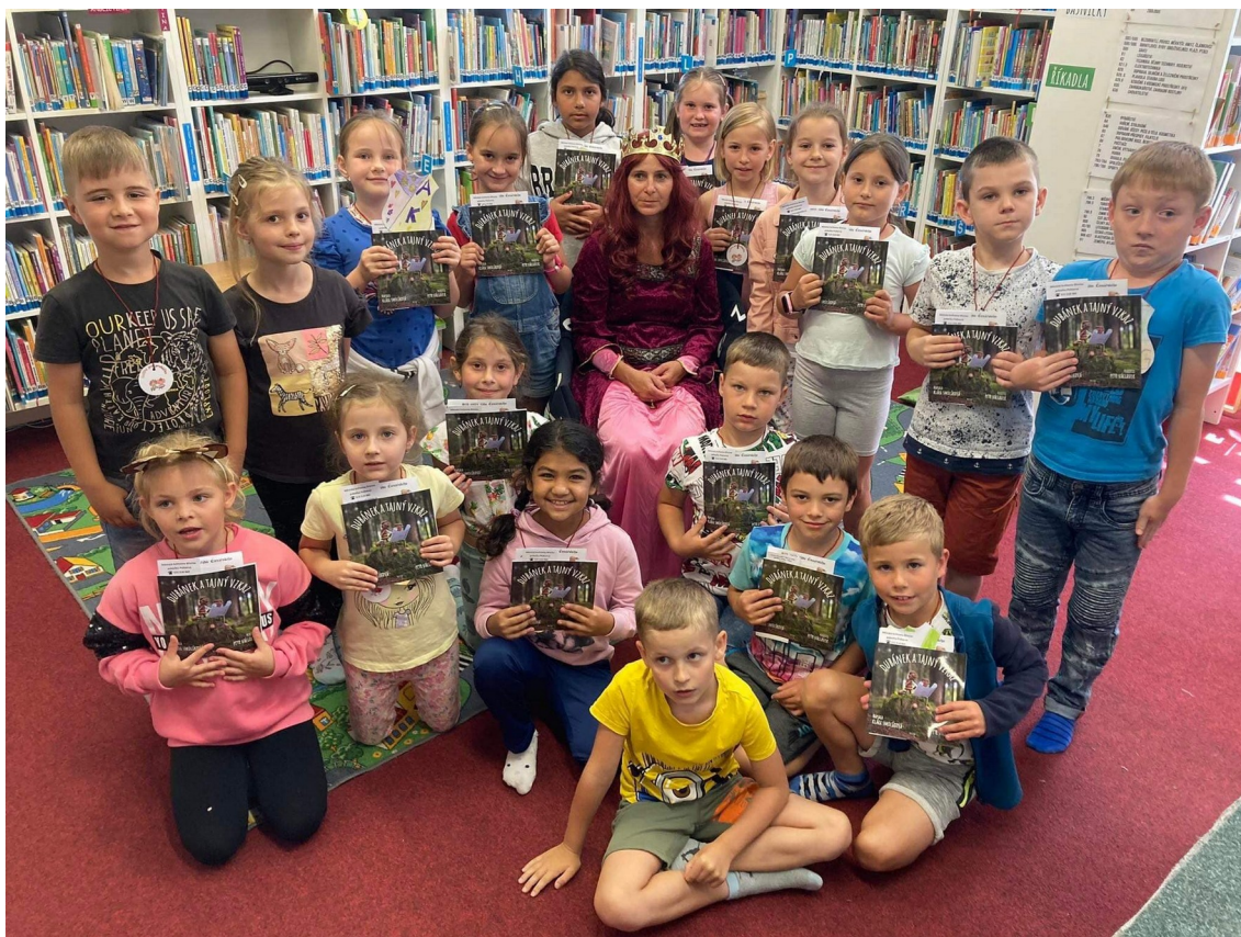
Městská knihovna Břeclav – pobočka Poštorná - Pasování na rytíře