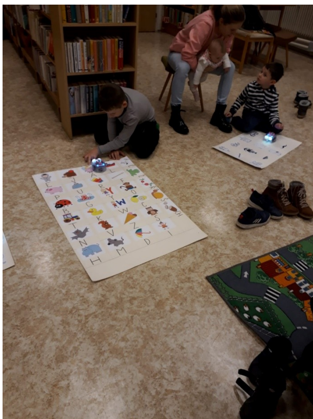
27. 1. 2022 Moderní technologie, odpoledne pro veřejnost, Maminky s dětmi a Blueboti. MěK Břeclav - pobočka Charvatská Nová Ves

Zapojení ozobotů, bluebotů a Virtuální reality do stávajících programů.