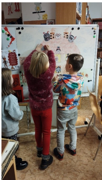
Městská knihovna Břeclav – pobočka Stará Břeclav, Knížka pro prvňáčka – Čertí škola

V Městské knihovně Veselí nad Moravou se zúčastnily všechny třídy prvňáků místních škol, projekt byl zakončen slavnostním pasováním