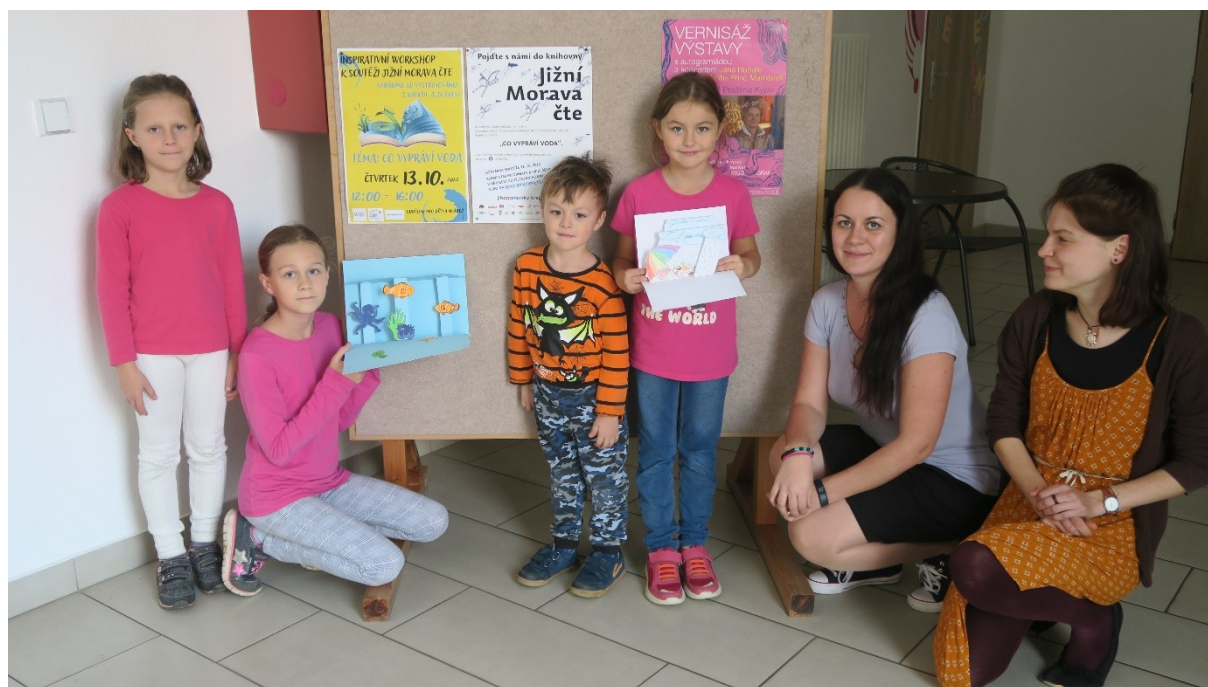
Městská knihovna Kyjov, projekt Jižní Morava čte

Městská knihovna Kyjov se projektové činnosti příliš nevěnují mimo projekty, které už jsou v rámci SKIPU, pravidelně se ale zapojují také do projektu Jižní Morava čte, kde se většinou daří celkem velké účasti ze stran školek i jednotlivých čtenářů. Loni bylo několik čtenářů také oceněno i v krajském kole soutěže.